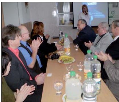
Urologický moravský seminář.