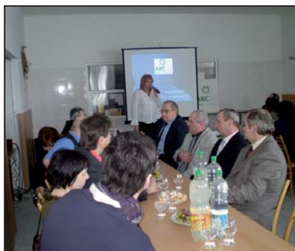
Výročí charty 2010 DPS Luká.